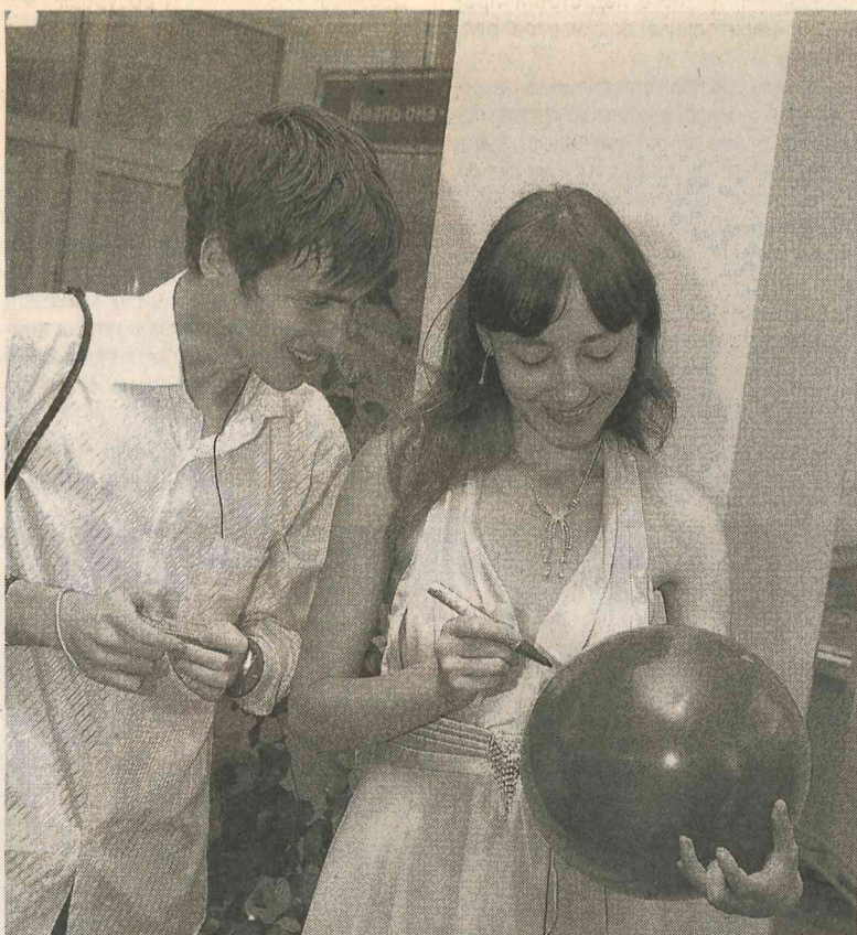
Молодые инженеры по традиции загадывали желания