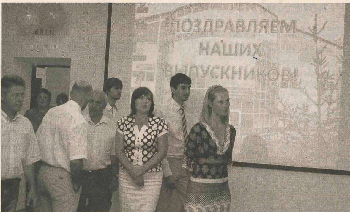
Выпускники поблагодарили преподавателей КУИЦ за полученные знания и семейную атмосферу