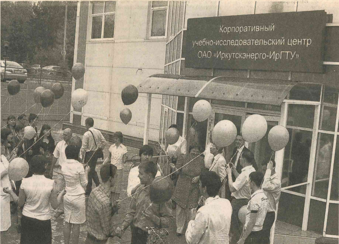
Вчерашние студенты-энергетики на пороге нового этапа в жизни